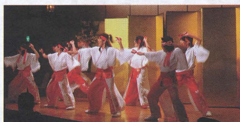
「夢笑志」の皆さんによるお祝い