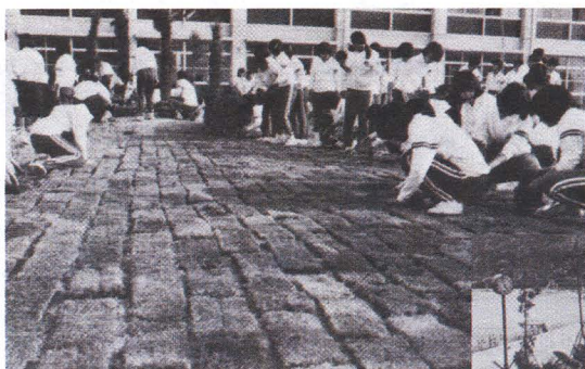
芝張り作業（昭和54年10月26日）

創立の数年前に高校が荒れた厳しい時代があり、別所高校が設立されたのは、それが少し落ちついてきた頃でした。殺伐とした状況を経験していた私達職員は誰もが、活発に伸び伸びと学習活動や部活動ができる学校を願い、そして生徒とともに学校をつくらうと考えていました。連日行われたさまざまなルールづくりのための会議でも、大事なところはきちんと押さえて、あまり細かいルールで生徒を縛らないで、信頼し生徒の自主性を育てようというのが共通認識であったと思います。残念ながら、生徒の人数が急激に増えていく中で、当初の理念が簡単に崩れてしまいました。精神性というか教育理念を0から1にし、さらに2にしていくことの難しさをつくづく思いました。そこには、何か創造力が必要