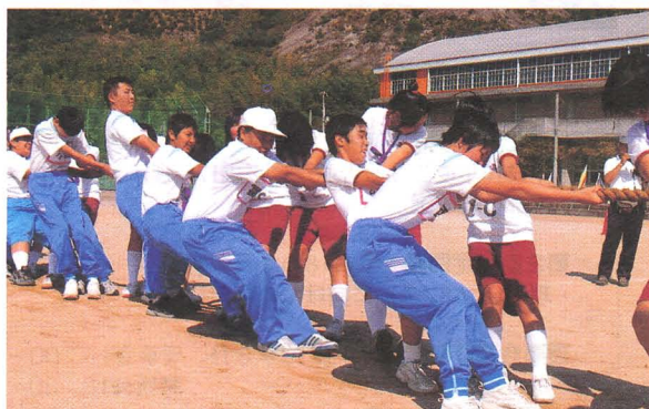
姫路養護との 交流体育祭